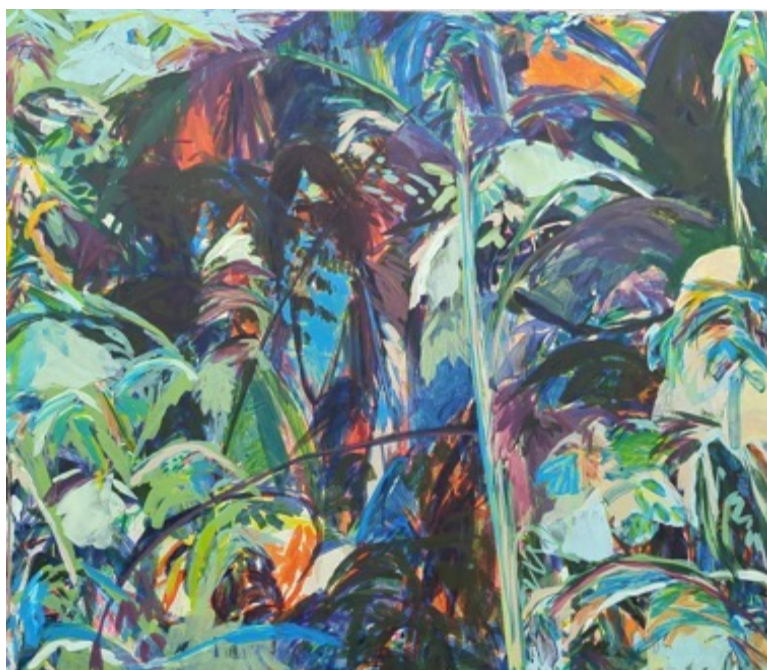
Julie Susset, Jaïba, Acrylique sur toile, 200 x 250 cm