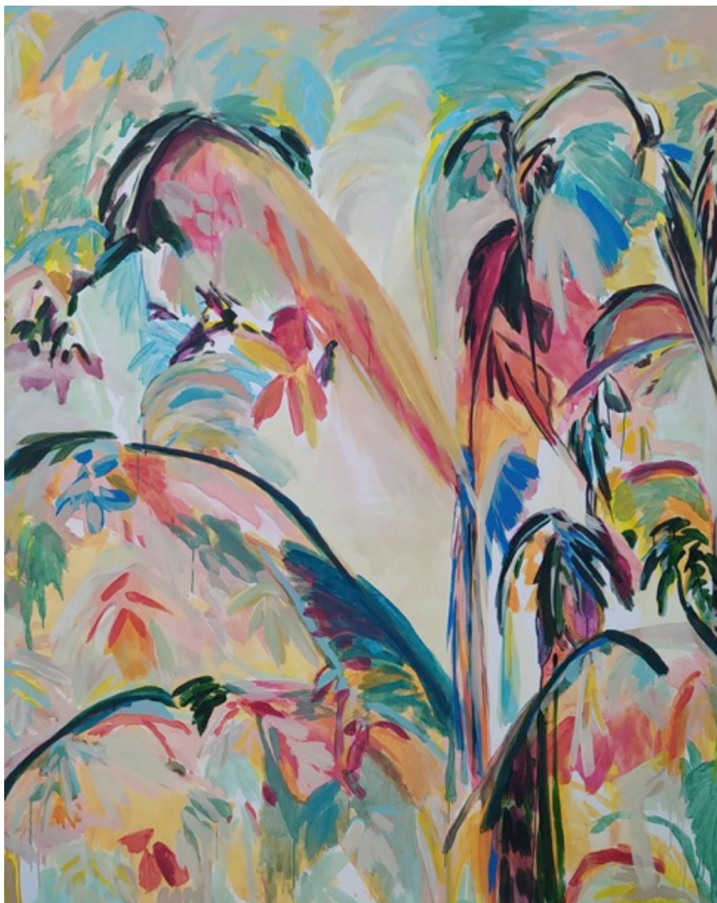
Julie Susset, Yulabie, Acrylique sur toile, 200x160 cm