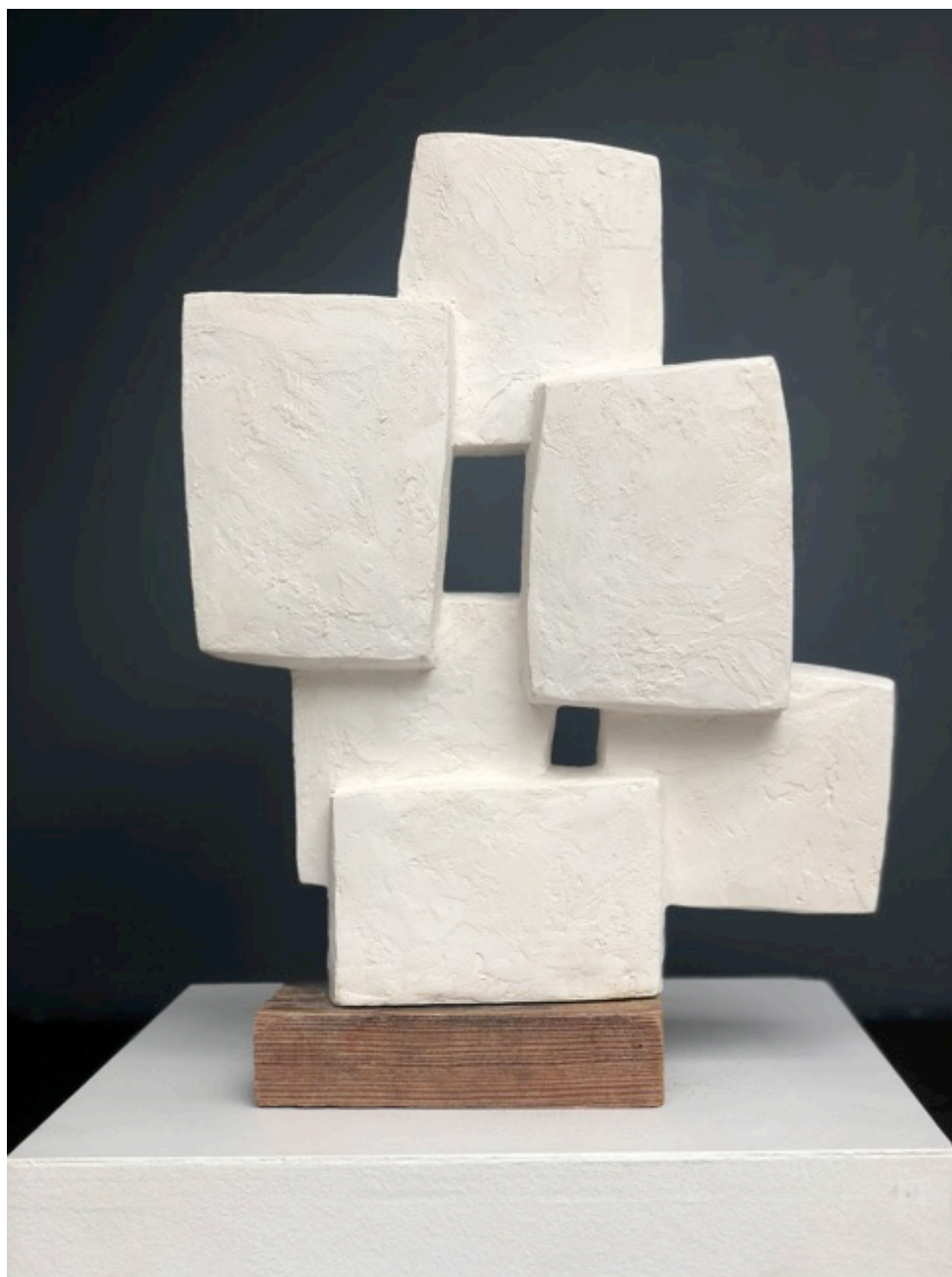
Delphine Brabant, Unité bois III, Plâtre, 37x27x10 cm