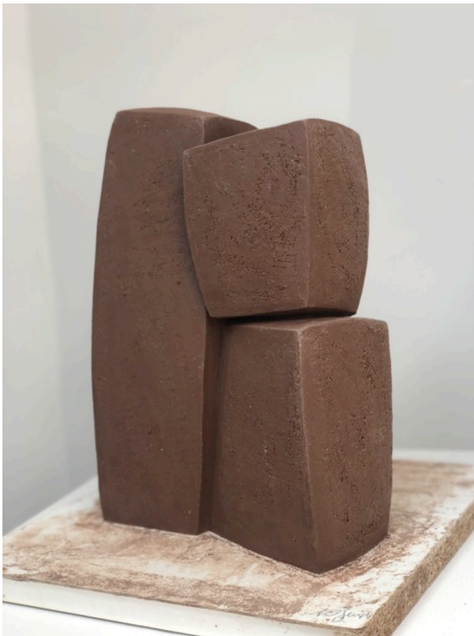
Delphine Brabant, Unité V, Terre en séchage, 30x22x13 cm